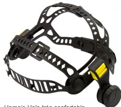
Harnais Halo très confortable, doté de 5 points de contact (vue avant)