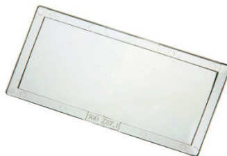
Lentille dioptrique grossissante