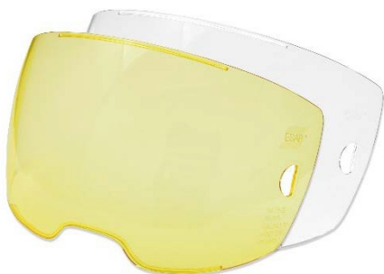
Visière extérieure HD