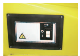
Operation simple interrupteur marche/arrêt