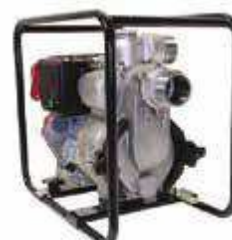
TED 80 RD