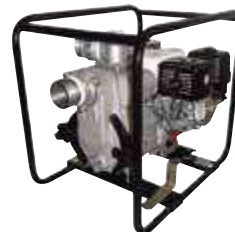
TED2 80 HA