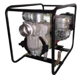
TED2 100 HA