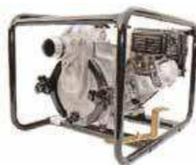
TED2 50 HA