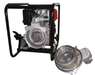
(HA) Modèles équipés d'une sécurité manque d'huile.