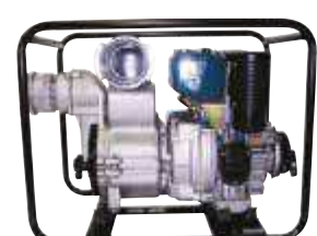
TED 100 RD