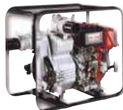
TED 50 RD