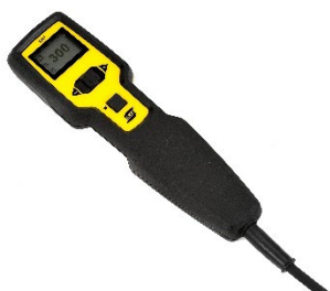
ER 1, commande à distance multifonction avec écran intégré