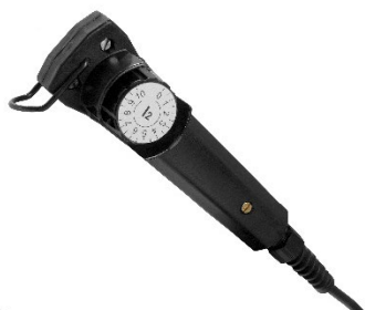
MMA 3, commande à distance traditionnelle destinée au réglage de l'intensité